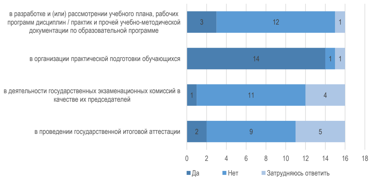
Рис. 1.1. Участие организаций/предприятий в деятельности университета