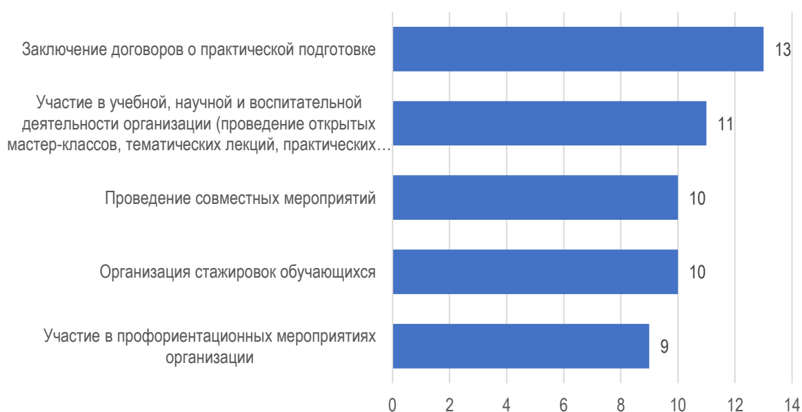
Рис. 4.2. Формы взаимодействия работодателей с университетом

В 13 из 16 организациях работодатели выразили готовность заключать договора о практической подготовке обучающихся (13 орг.), проводить открытые мастер-классы, тематические лекции, практические занятия, научные мероприятия и др. (11 орг.), участвовать с университетом в проведении совместных организаций, а также могли поспособствовать в организации стажировок обучающихся (рис. 4.2).