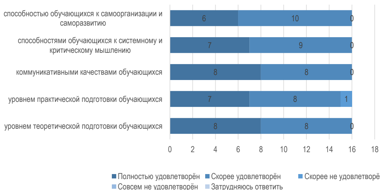
Рис. 2.2. Удовлетворенность работодателей уровнем подготовки обучающихся МГППУ

получили достаточной удовлетворенности от уровня практической подготовки обучающихся (рис. 2.2).