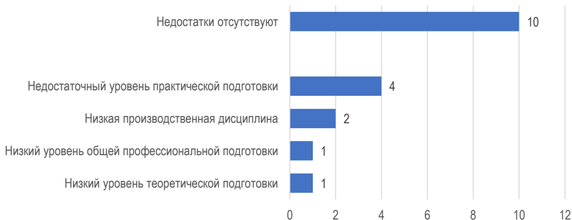
Рис. 2.4. Слабые стороны обучающихся МГППУ: оценка работодателей

В 10 из 16 организациях/предприятиях не смогли указать на недостатки в подготовке обучающихся университетом. В четырех организациях указали на недостаточный уровень практической подготовки. Еще в двух организациях работодателям не понравилась в обучающихся низкая производственная дисциплина, а в двух оказалось недостаточным уровень общей профессиональной и теоретической подготовки студентов (рис. 2.4).