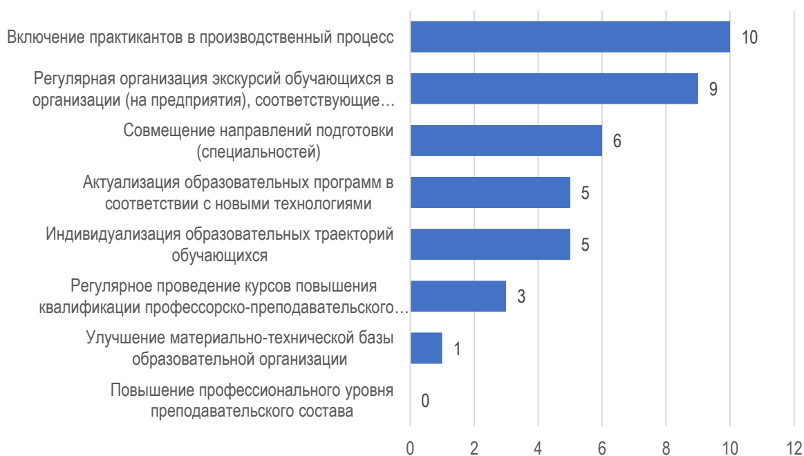
Рис. 3.1. Предложения по изменению образовательной программы: оценка работодателя

Для успешного трудоустройства практически все работодатели рекомендуют студентам свой багаж знаний и навыков непременно пополнять в первую очередь знанием законодательства (14 орг.), а также навыками делового общения (9 орг.). Отметим, что знание иностранного языка не оказывает значимого влияния при трудоустройстве в организации работодателей, участвующих в опросе (рис. 3.2).