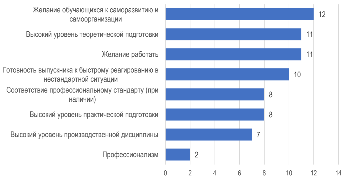
Рис. 2.3. Сильные стороны обучающихся МГППУ: оценка работодателей

К числу сильных сторон подготовки обучающихся МГППУ работодатели относят яркое желание обучающихся к саморазвитию и самоорганизации (12 орг.), высокий уровень теоретической подготовки (11 орг.), желание работать (11 орг.) и готовность выпускника к быстрому реагированию в нестандартных ситуациях (10 орг.). Несколько ниже в обучающихся работодатели отмечают уровень профессионализма, что выглядит достаточно логично, поскольку это пока только молодые специалисты (рис. 2.3).