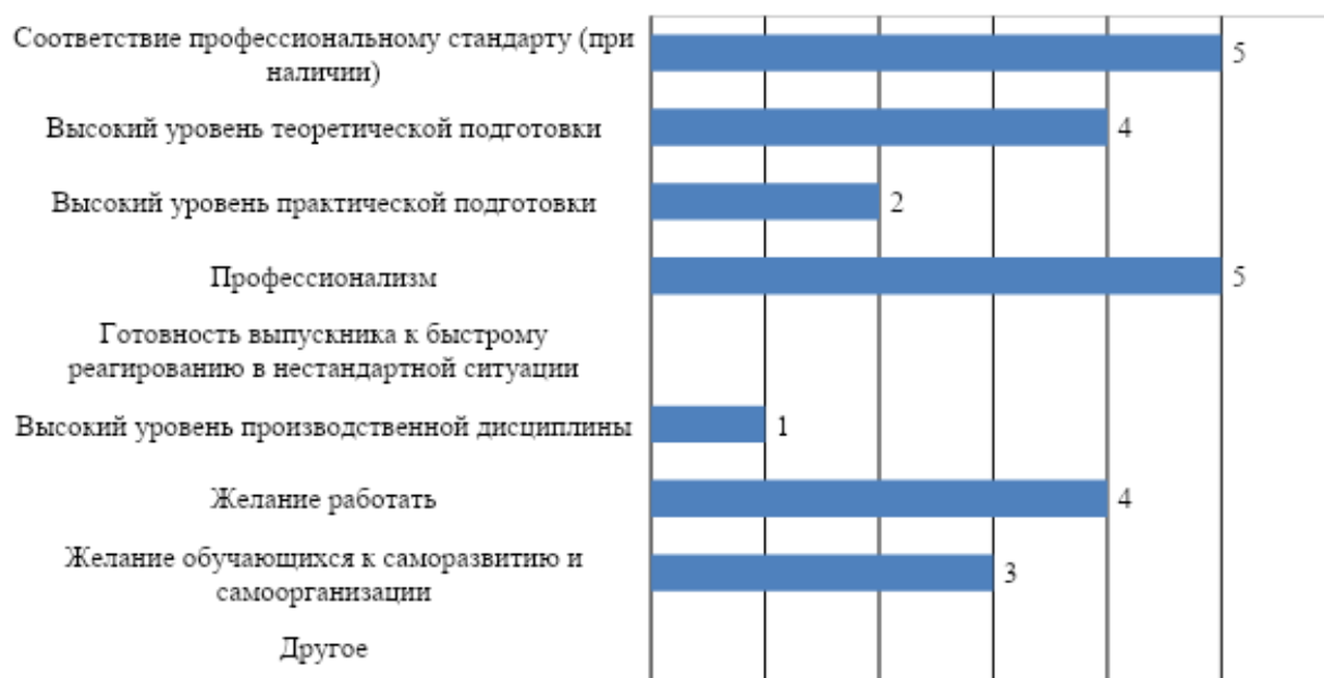
Рис. 2. Оценка работодателей: сильные стороны подготовки обучающихся университета

К числу основных сильных сторон подготовки обучающихся МГППУ работодатели в первую очередь относят: соответствие профессиональному стандарту и профессионализм. Несколько реже работодатели отмечали высокий уровень теоретической подготовки и желание работать (рис. 2). Реже всего респонденты упоминали в качестве сильных сторон подготовки обучающихся университета высокий уровень производственной дисциплины. Ни один из опрошенных не выделил в качестве сильной стороны обучающихся готовность к быстрому реагированию в нестандартной ситуации.