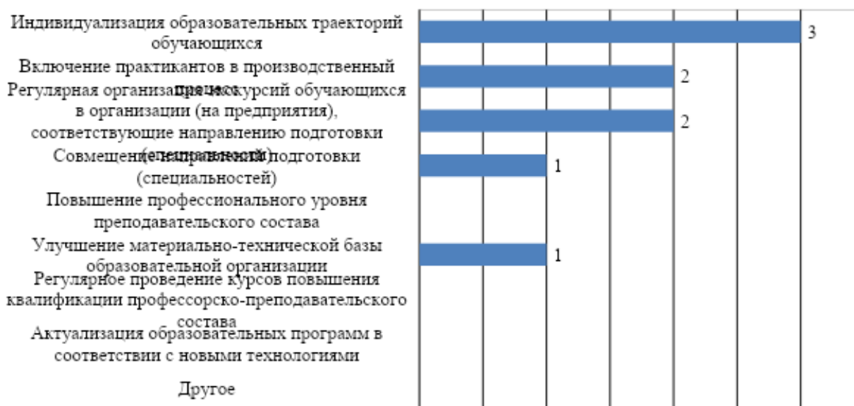
Рис. 4. . Изменения, которые необходимо внести в образовательный процесс по программе для повышения качества подготовки обучающихся

Для повышения эффективности подготовки обучающихся работодатели рекомендовали, в первую очередь, индивидуализировать образовательные траектории обучающихся. Кроме того, предлагается включить практикантов в производственный процесс; организовывать регулярные организации экскурсий обучающихся в организации (на предприятия), соответствующие направлению подготовки (специальности); улучшить материально-техническую базу образовательной организации; организовать совмещение направлений подготовки (специальностей) (рис. 4).