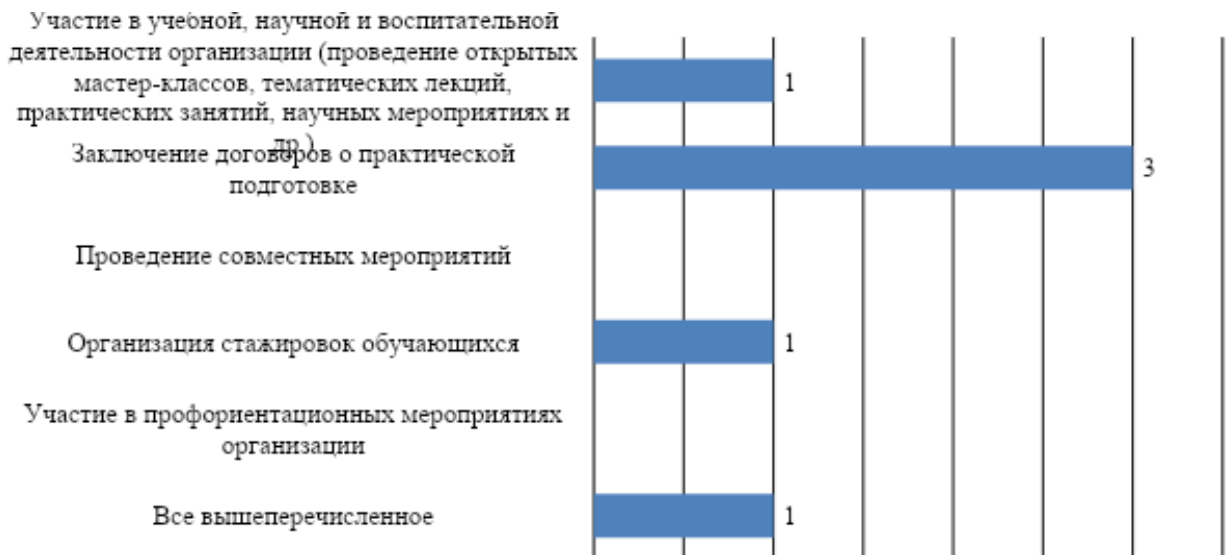
Рис. 6. Перспективы развития деловых связей и сотрудничества организаций с МГППУ