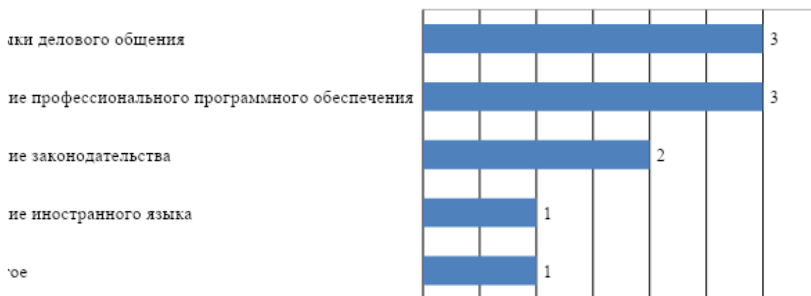
Рис. 1. Дополнительные знания и умения обучающихся необходимые для успешного трудоустройства.

К числу основных сильных сторон подготовки обучающихся МГППУ работодатели в первую очередь относят: соответствие профессиональному стандарту и профессионализм. Несколько реже работодатели отмечали высокий уровень теоретической подготовки и желание работать (рис. 2). Реже всего респонденты упоминали в качестве сильных сторон подготовки обучающихся университета высокий уровень производственной дисциплины. Ни один из опрошенных не выделил в качестве сильной стороны обучающихся готовность к быстрому реагированию в нестандартной ситуации.