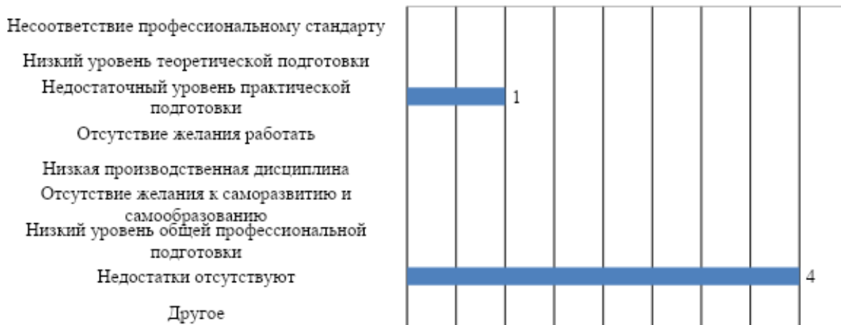
Рис. 3. Оценка работодателей: слабые стороны подготовки обучающихся университета

Для повышения эффективности подготовки обучающихся работодатели рекомендовали, в первую очередь, индивидуализировать образовательные траектории обучающихся. Кроме того, предлагается включить практикантов в производственный процесс; организовывать регулярные организации экскурсий обучающихся в организации (на предприятия), соответствующие направлению подготовки (специальности); улучшить материально-техническую базу образовательной организации; организовать совмещение направлений подготовки (специальностей) (рис. 4).