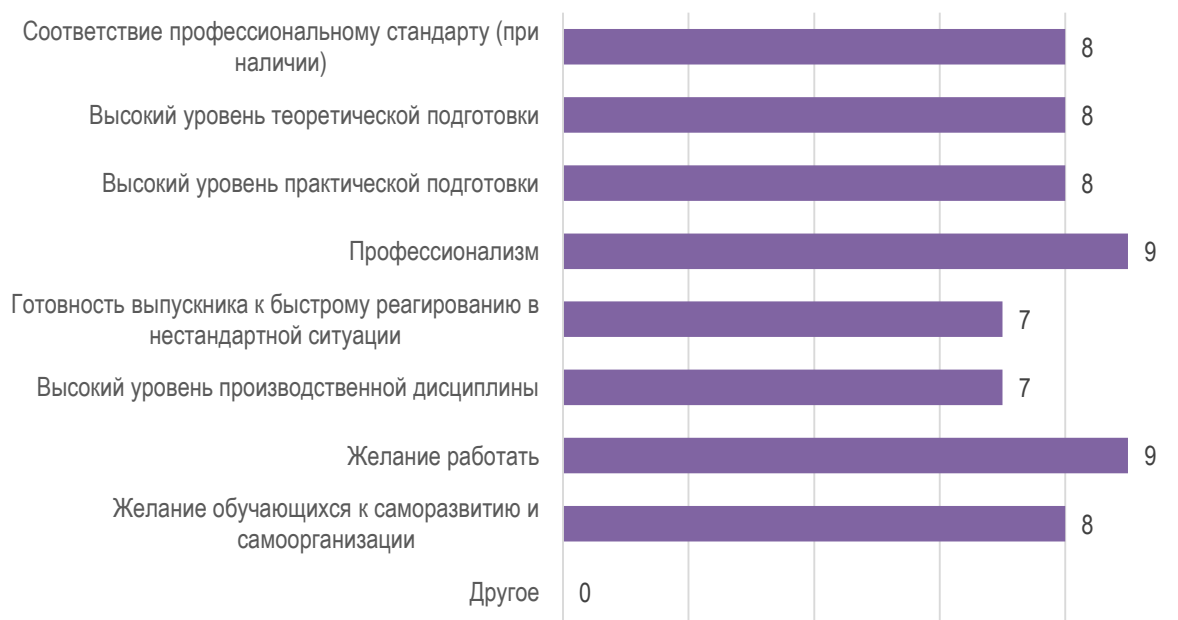
Рис. 2. Оценка работодателей: сильные стороны подготовки обучающихся университета

К числу основных сильных сторон подготовки обучающихся МГППУ работодатели в первую очередь относят: желание работать и профессионализм. Несколько реже участники опроса обращали внимание на соответствие профессиональному стандарту, высокий уровень теоретической и практической подготовки, желание обучающихся к саморазвитию и самоорганизации (рис. 2). Также представители работодателей упоминали в качестве сильных сторон подготовки обучающихся университета готовность выпускника к быстрому реагированию в нестандартной ситуации, высокий уровень производственной дисциплины.