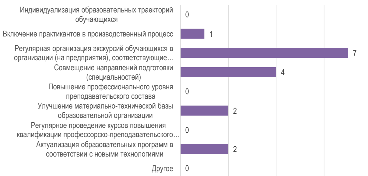
Рис. 3. . Изменения, которые необходимо внести в образовательный процесс по программе для повышения качества подготовки обучающихся

Для повышения эффективности подготовки обучающихся работодатели рекомендовали, в первую очередь, организовывать регулярные организации экскурсий обучающихся в организации (на предприятия), соответствующие направлению подготовки (специальности), а также организовать совмещение направлений подготовки (специальностей). Кроме того, рекомендуется улучшить материально-техническую базу образовательной организации и актуализировать образовательные программы в соответствии с новыми технологиями (рис. 3). Один из участников опроса считает необходимым включение практикантов в производственный процесс.