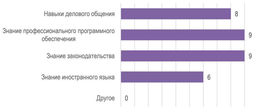
Рис. 1. Дополнительные знания и умения обучающихся необходимые для успешного трудоустройства.

К числу основных сильных сторон подготовки обучающихся МГППУ работодатели в первую очередь относят: желание работать и профессионализм. Несколько реже участники опроса обращали внимание на соответствие профессиональному стандарту, высокий уровень теоретической и практической подготовки, желание обучающихся к саморазвитию и самоорганизации (рис. 2). Также представители работодателей упоминали в качестве сильных сторон подготовки обучающихся университета готовность выпускника к быстрому реагированию в нестандартной ситуации, высокий уровень производственной дисциплины.