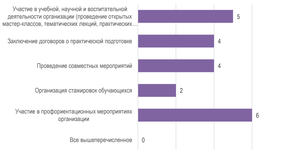
Рис. 5. Перспективы развития деловых связей и сотрудничества организаций с МГППУ

К числу основных форм развития деловых связей и сотрудничества организаций с университетом работодатели отнесли участие в профориентационных мероприятиях организации, учебной, научной и воспитательной деятельности организации (проведение открытых мастер-классов, тематических лекций, практических занятий, научных мероприятиях и др.), заключение договоров о практической подготовке, а также в проведении совместных мероприятий (рис. 5).