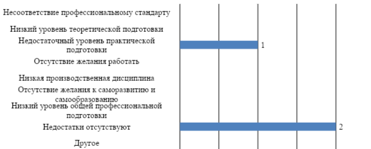
Рис. 3. Оценка работодателей: слабые стороны подготовки обучающихся университета

Все участники опроса выразили готовность и в будущем принимать выпускников МГППУ на работу, это еще раз подтверждает, что уровень подготовки выпускников их полностью удовлетворяет.