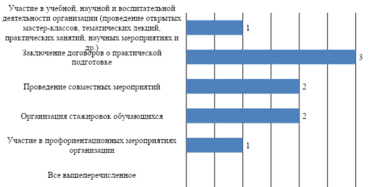
Рис. 5. Перспективы развития деловых связей и сотрудничества организаций с МГППУ

К числу основных форм развития деловых связей и сотрудничества организаций с университетом работодатели отнесли заключение договоров о практической подготовке, проведение совместных мероприятий, организацию стажировок обучающихся. Несколько реже в качестве перспективных направлений для сотрудничества респонденты указывали участие в учебной, научной и воспитательной деятельности организации (проведение открытых мастер-классов, тематических лекций, практических занятий, научных мероприятиях и др.), в профориентационных мероприятиях организации (рис. 5).