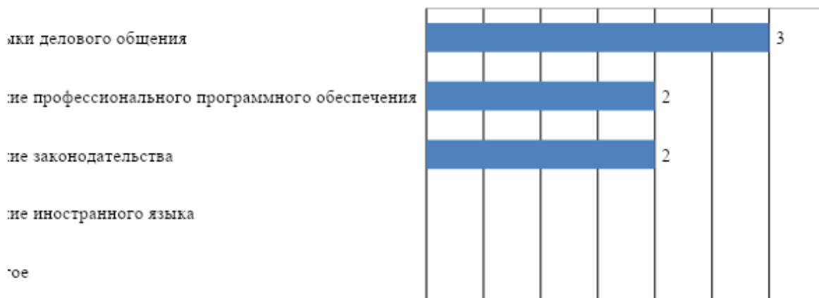
Рис. 1. Дополнительные знания и умения обучающихся необходимые для успешного трудоустройства.

К числу основных сильных сторон подготовки обучающихся МГППУ работодатели в первую очередь относят: соответствие профессиональному стандарту и профессионализм. Кроме того, участники опроса отметили высокий уровень практической подготовки, высокий уровень производственной дисциплины, готовность выпускника к быстрому реагированию в нестандартной ситуации, желание работать и стремление обучающихся к саморазвитию и самоорганизации (рис. 2). Реже всего респонденты упоминали в качестве сильных сторон подготовки обучающихся университета высокий уровень теоретической подготовки.