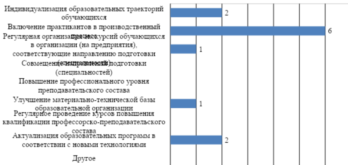
Рис. 5. . Изменения, которые необходимо внести в образовательный процесс по программе для повышения качества подготовки обучающихся