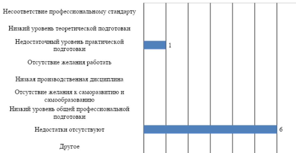
Рис. 4. Оценка работодателей: слабые стороны подготовки обучающихся университета

Остальные участники опроса не выделили никакие слабые стороны в подготовке обучающихся университета.