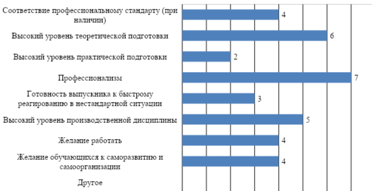
Рис. 3. Оценка работодателей: сильные стороны подготовки обучающихся университета

К числу основных сильных сторон подготовки обучающихся МГППУ работодатели в первую очередь относят профессионализм. Кроме того, участники опроса отметили высокий уровень теоретической подготовки, высокий уровень производственной дисциплины, (рис. 3). Реже всего респонденты упоминали в качестве сильных сторон подготовки обучающихся университета высокий уровень практической подготовки.