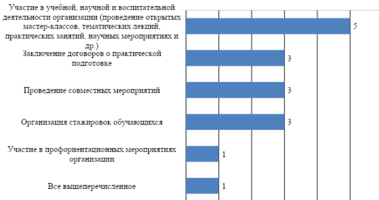
Рис. 6. Перспективы развития деловых связей и сотрудничества организаций с МГППУ

практических занятий, научных мероприятиях и др.). Половина участников опроса готовы к проведению совместных мероприятий, заключению договоров о практической подготовке, организации стажировок обучающихся (рис. 6). Один представитель работодателей выразил готовность развивать сотрудничество с МГППУ по всем предложенным вариантам.