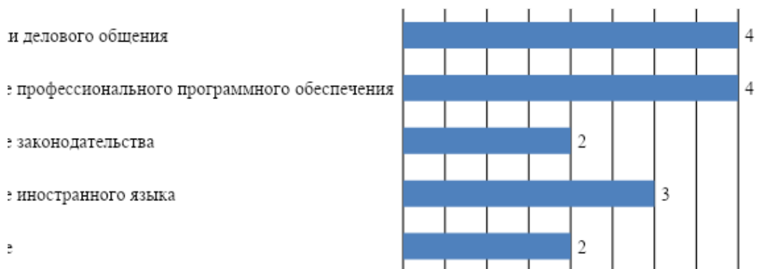
Рис. 2. Дополнительные знания и умения обучающихся необходимые для успешного трудоустройства

Для успешного трудоустройства, по мнению представителей работодателей, у обучающихся должен быть целый спектр дополнительных знаний и умений, причем знание законодательства и иностранного языка уступают по актуальности навыкам делового общения и знанию профессионального программного обеспечения (рис. 2).