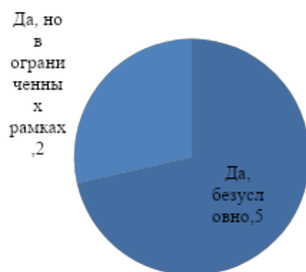
Рис. 5. Желание развивать деловые связи и сотрудничество с МГППУ

Большинство представителей работодателей хотели бы и в дальнейшем развивать деловые связи и сотрудничество с МГППУ, выбрав вариант ответа «Да, безусловно» (рис. 5).