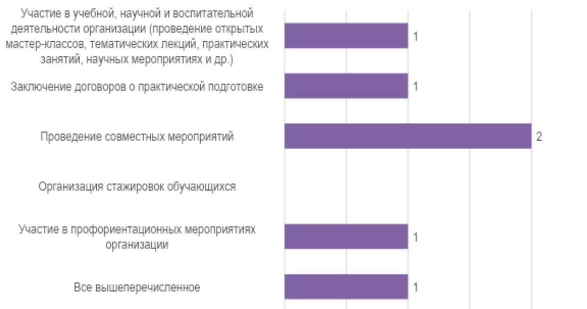
Рис. 6. Перспективы развития деловых связей и сотрудничества организаций с МГППУ