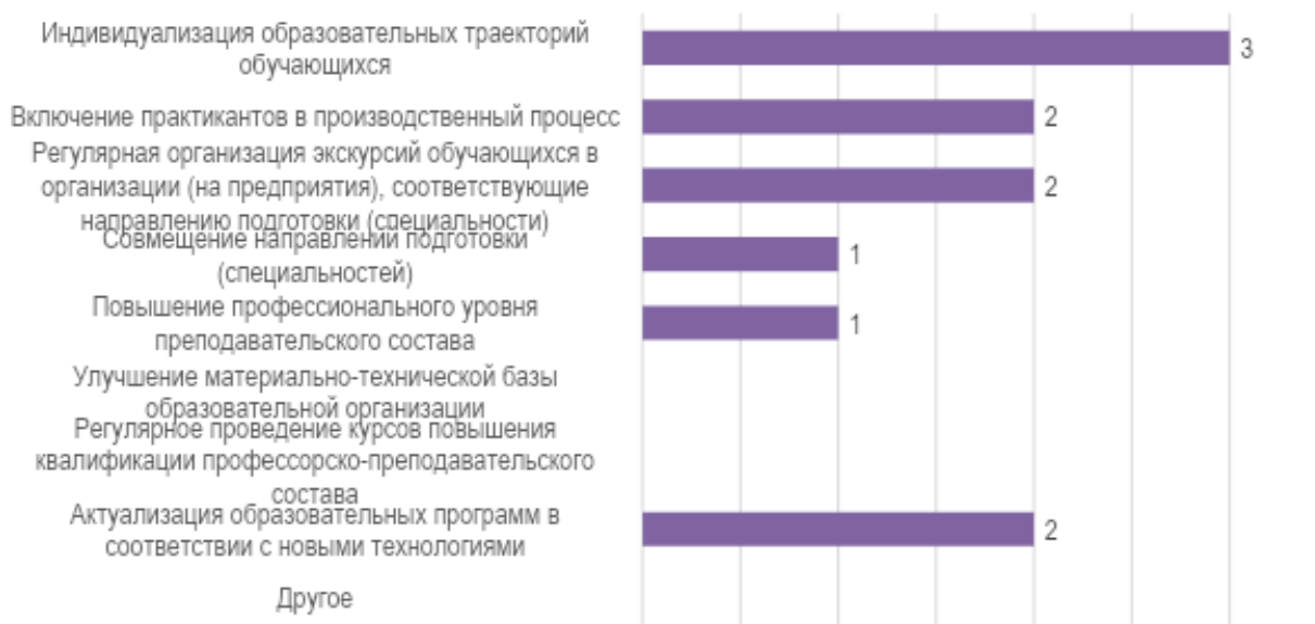
Рис. 5. Изменения, которые необходимо внести в образовательный процесс по программе для повышения качества подготовки обучающихся