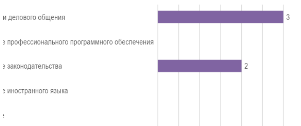
Рис. 3. Дополнительные знания и умения обучающихся необходимые для успешного трудоустройства.

Для успешного трудоустройства, по мнению представителей работодателей образовательных организаций, для обучающихся достаточно иметь навыки делового общения, а также знание законодательства (рис. 3). На знаниях профессионального программного обучения и иностранного языка работодателями даже не акцентировали внимание.