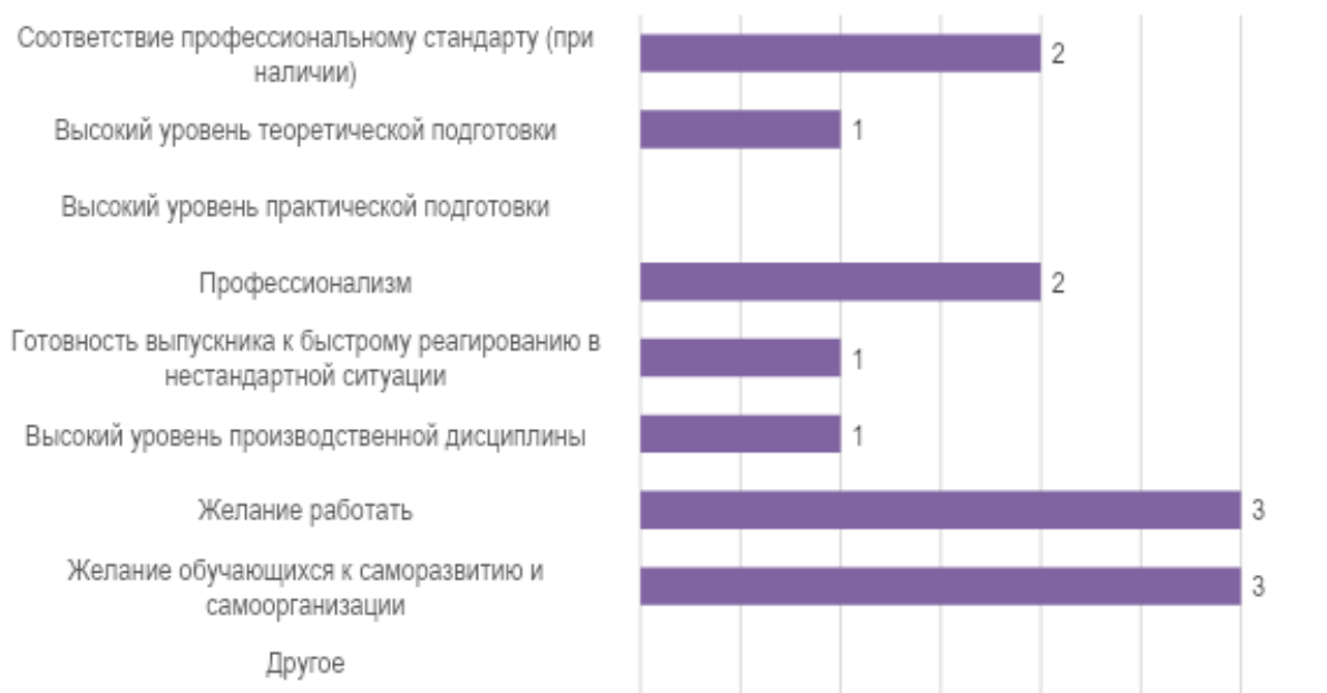
Рис. 4. Оценка работодателей: сильные стороны подготовки обучающихся университета

числу сильных сторон подготовки обучающихся представители работодателей отнесли профессионализм обучающихся и соответствие их подготовки профессиональному стандарту. В третью очередь представители образовательных организаций выделяют высокий уровень теоретической подготовки, высокий уровень производственной дисциплины и готовность выпускников к быстрому реагированию в нестандартной ситуации.