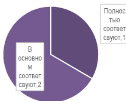
Рис. 1. Соответствие компетенций обучающихся, сформированных при освоении образовательной программы, профессиональным стандартам

Все работодатели достаточно высоко оценивают компетенции обучающихся, сформированные при освоении образовательной программы: один из трех считает, что компетенции обучающихся полностью соответствуют профессиональным стандартам, а двое из трех работодателей поставили чуть ниже оценку, но все равно достаточно высокую, и считают, что компетенции в основном соответствуют профессиональным стандартам (рис. 1).