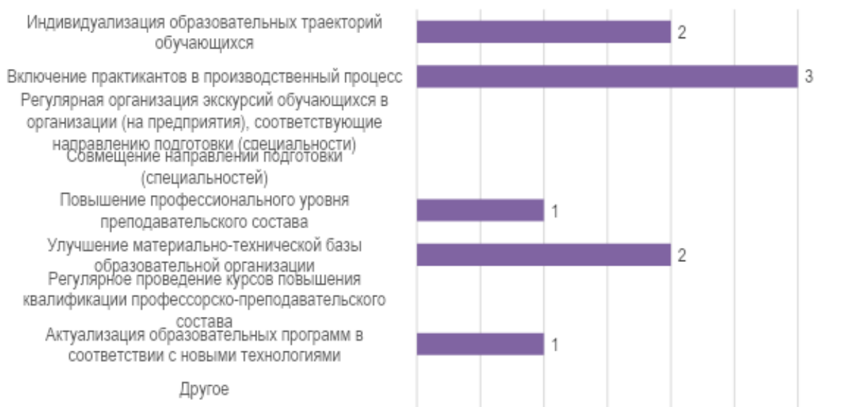
Рис. 4. . Изменения, которые необходимо внести в образовательный процесс по программе для повышения качества подготовки обучающихся

Для повышения эффективности подготовки обучающихся работодатели рекомендовали, включить практикантов в производственный процесс, улучшить материально-техническую базу образовательной организации, а также индивидуализировать образовательную траекторию обучающихся (рис. 4).