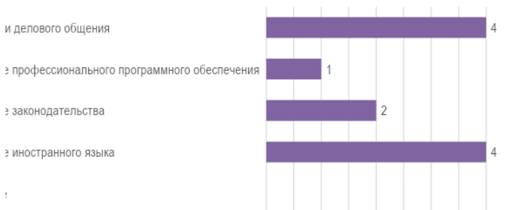
Рис. 1. Дополнительные знания и умения обучающихся необходимые для успешного трудоустройства.

Для успешного трудоустройства, по мнению представителей работодателей, у обучающихся должен быть целый спектр дополнительных знаний и умений. В первую очередь для работодателей важны навыки делового общения и знание иностранного языка (рис. 1). В меньшей степени в обучающихся востребовано знание профессионального программного обеспечения.