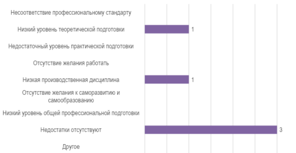
Рис. 3. Оценка работодателей: слабые стороны подготовки обучающихся университета

К числу слабых сторон в подготовке обучающихся университета работодатели отнесли низкий уровень теоретической подготовки, а также низкую производственную дисциплину. Именно этих качеств не хватило представителю организации сферы образования (рис. 3).