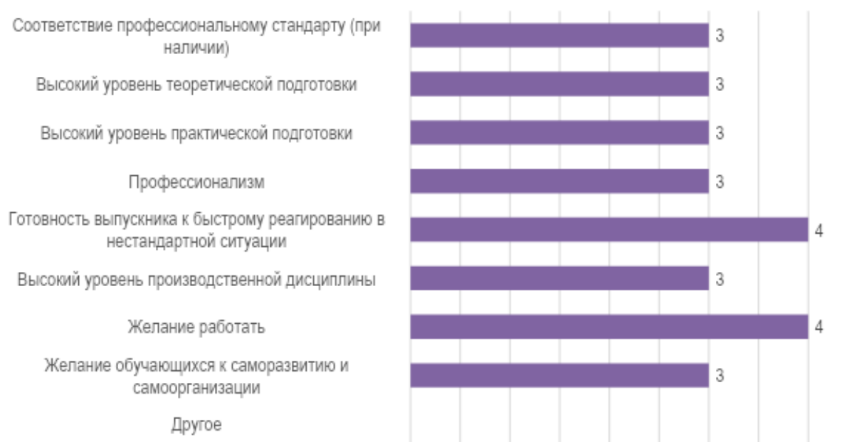
Рис. 2. Оценка работодателей: сильные стороны подготовки обучающихся университета

К числу основных сильных сторон подготовки обучающихся МГППУ работодатели в первую очередь относят: готовность выпускника к быстрому реагированию в нестандартных ситуациях, а также желание работать (каждый участник опроса в первую очередь обратил именно на эти стороны и качества выпускников) (рис. 2).